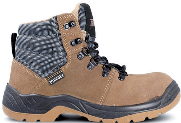
COUNTRY II CM5048 MA · 36/48