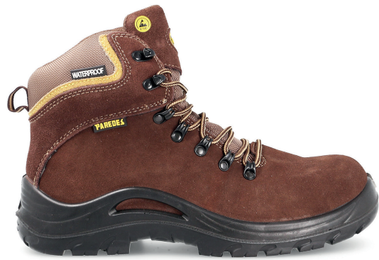
GORBEA SP5205 MAO · 36/48

Corte en piel serraje. Puntera de acero. Plantilla antiperforación de acero. Suela de poliuretano doble densidad. Split leather upper. Steel toe. Steel anti-perforation insole. Double density polyurethane sole.