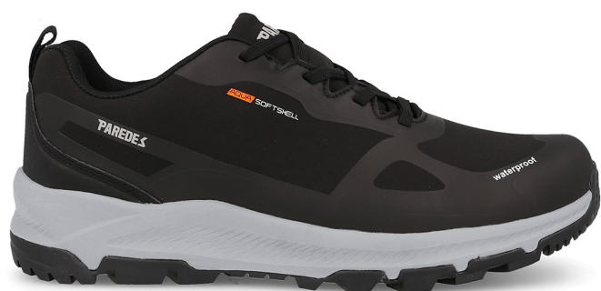
REDUEÑA LT24518 NE · 36/48

Corte en piel reciclada "REVIVUS". Suela TPR. Plantilla Viscoactiv. Recycled REVIVUS leather upper. TPR sole. Viscoactive insole.