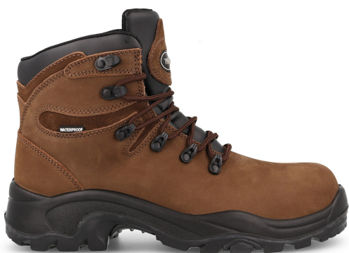
GARDA SP5206 MA · 36/48