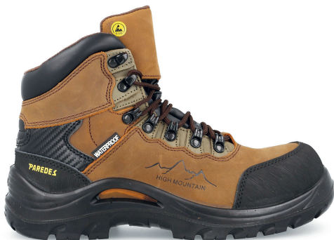
CAZALLA SP5207 MA-VE · 36/48

S3 CI HI WR SRC ESD (2011) - S7S FO SR CI HI ESD (2022)