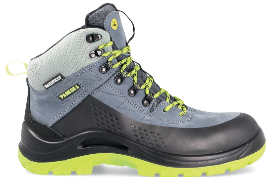
ENDINO SP5204 GR-VE · 36/48

S3 CI HI WR SRC ESD (2011) - S7S FO SR CI HI ESD (2022)