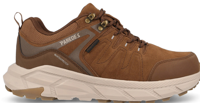
MONTESA LT25553 MA · 39/46

Corte en piel serraje. Suela PU-PU. Membrana Waterproof PARETEX. Suede leather upper. PU-PU sole. Waterproof PARETEX membrane.