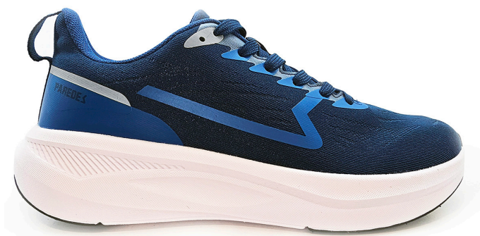
LETUR LD25544 AZM · 36/48

Corte textil. Suela EVA. Textile upper. EVA sole.