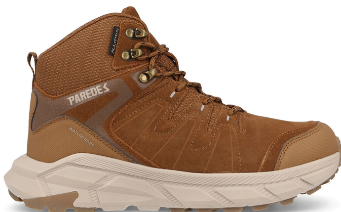
CIERVO LT25139 MA · 39/46

Corte en nubuck. Suela de EVA + caucho nitrilo. Membrana Waterproof PARETEX. Nubuck upper. EVA + nitrile rubber sole. Waterproof PARETEX membrane.