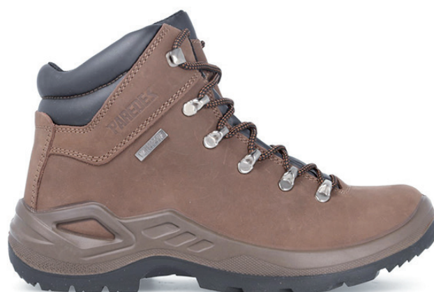
VELETA LM20208 MAO · 39/46

Corte en nubuck. Suela de caucho nitrilo. Membrana Waterproof PARETEX. Nubuck upper. Nitrile rubber sole. Waterproof PARETEX membrane.