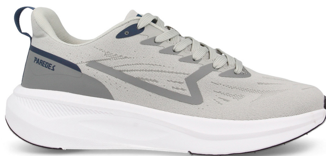
LETUR LD25544 GR · 36/48

Corte textil. Suela EVA. Textile upper. EVA sole.