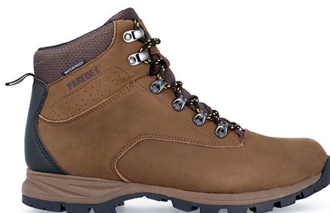
GELADA LM20350 MA · 39/46

Corte textil. Suela EVA. Textile upper. EVA sole.