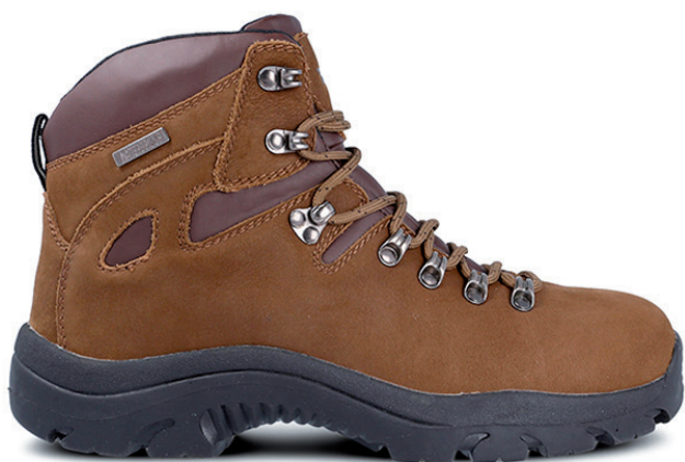
RONCESVALLES LM347 MAO · 39/47

Corte en piel serraje. Suela de poliuretano doble densidad. Split leather upper. Double density polyurethane sole.