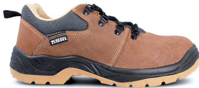
SONORA LM418 MA · 36/48

Corte en piel serraje. Suela de poliuretano doble densidad. Split leather upper. Double density polyurethane sole.