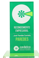
PREMIO CEDELCO 2023

PREMIO A LA INVESTIGACIÓN Y DESARROLLO DE NUEVOS PRODUCTOS