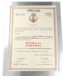
PREMIO COAC 2021

PREMIO A LA INVESTIGACIÓN Y DESARROLLO DE NUEVOS PRODUCTOS