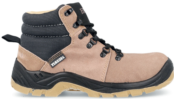
TERRA SP5091 MA · 36/48