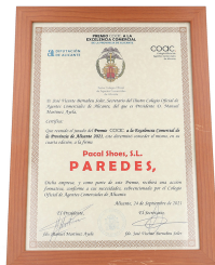
PREMIO COAC 2021